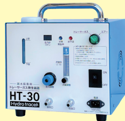
▲水素ガス造成装置ハイドロ トレーサーHT-30

微量の水素ガスを使って安全・確実に水漏れ箇所を特定できる次世代の調査方法です。最大の特徴が非破壊方式であり、従来必要であった調査掘削やそれに伴う原状復帰工事が不要となる上に、短時間で漏水箇所を特定できることから、人件費などのコストも大幅に削減できます。