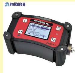
▲水素ガス探知機ハンターH2